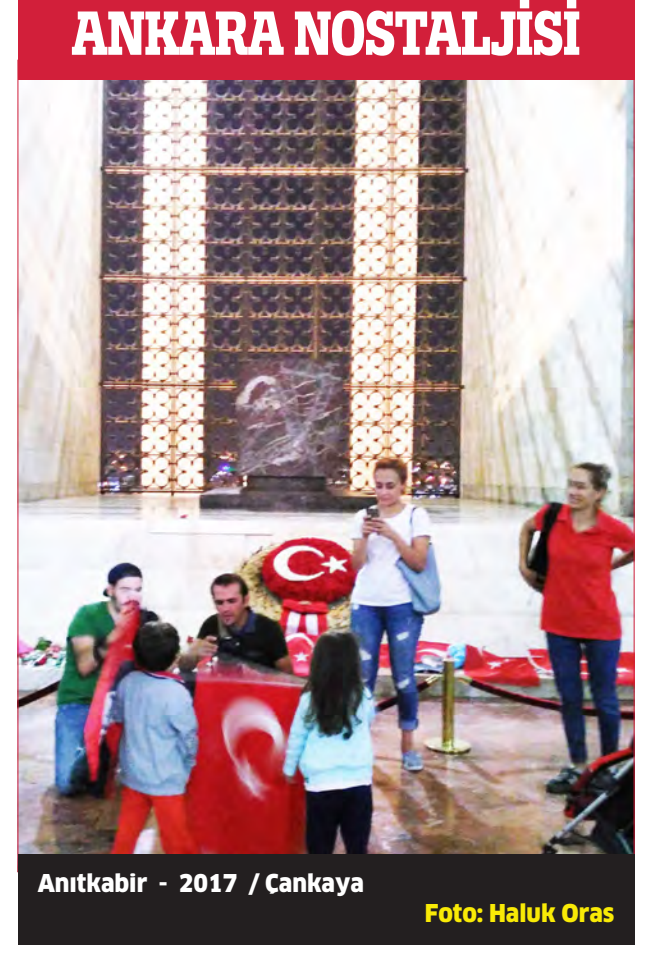
Anıtkabir - 2017 / Cankaya

Sergi, genç sanatçıların sanatçı bedeni, günlük nesnelere ve çevre gibi temaları işlediği eserleriyle dikkat çekiyor. Bu eserler, bozulma olgusunu derinlemesine inceleyerek izleyicilere yeni düşünce ve duygular yaşatmayı amaçlıyor. Sanatseverler, CerModern'deki bu etkileyici sergiyi 7 Haziran'a kadar ziyaret edebilir.