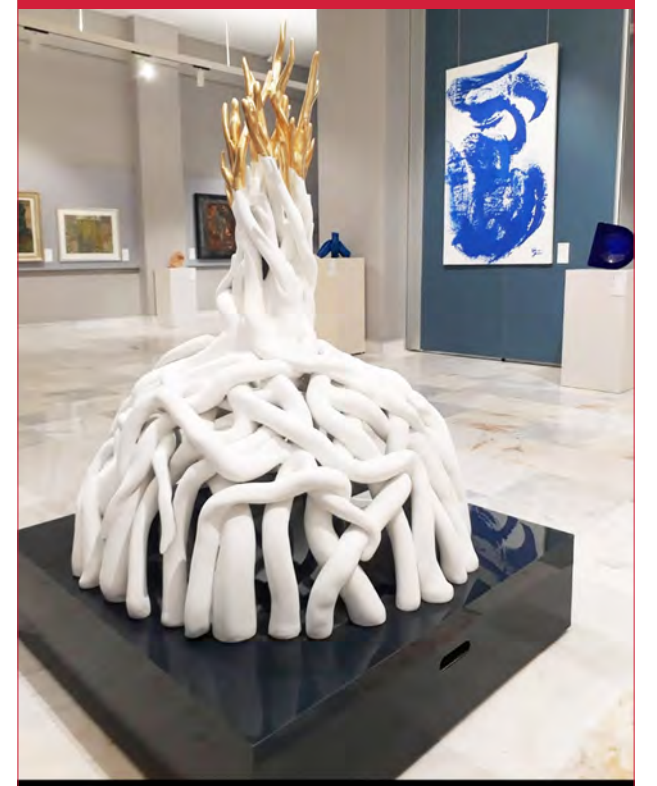
Resim ve Heykel Müzesi / Altındağ - 2022

rinde ve yaktılarda kullanılır. Özellikle hava yastıklarında hızlı tepki verme özelliğiyle önemli bir rol oynar.