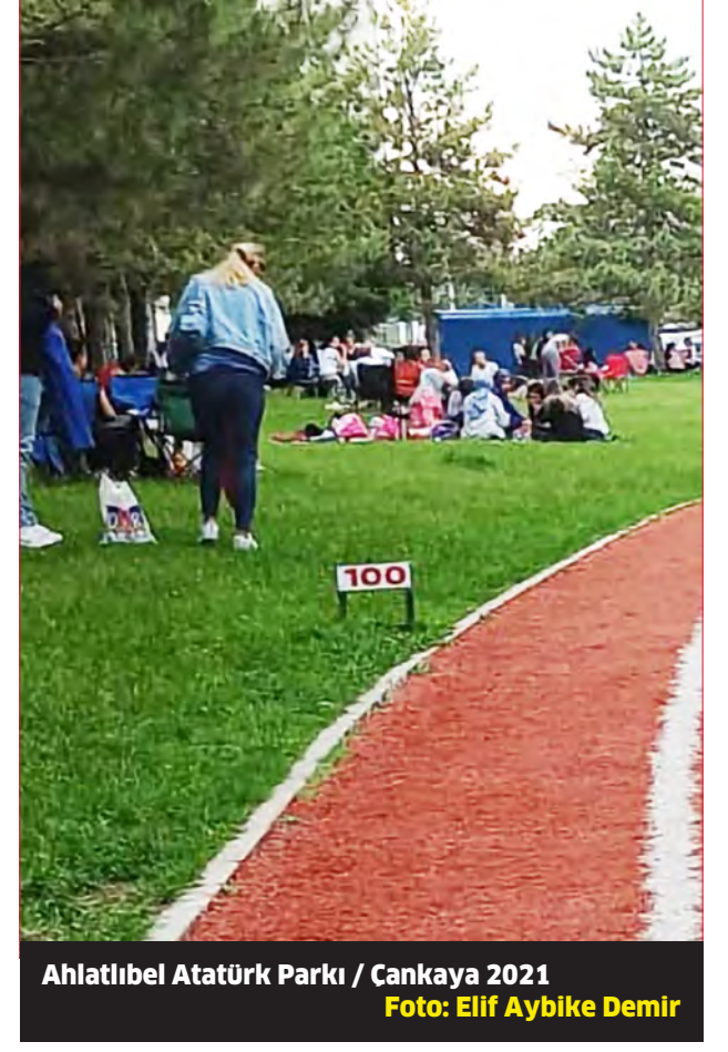
Ahlatlıbel Atatürk Parkı / Cankaya 2021