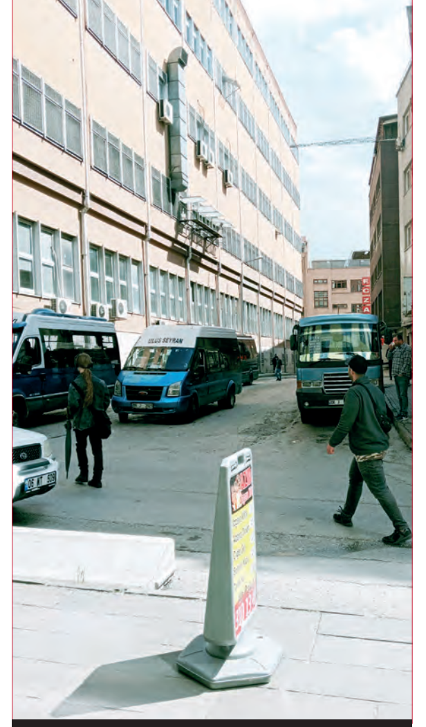
Zafer Sokak / Ulus - Altındağ - 2016