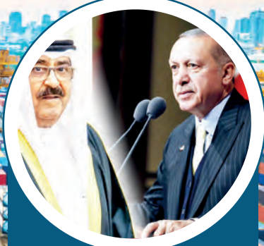
Kalabalık bir heyetle Türkiye'ye gelen Seyh Mesal, Cumhurbaşkanı Recep Tayyip Erdoğan ve kabine üyeleri ile toplantı yaptı.

S ON birkaç yıl içerisinde 7 kez kabinenin iflas ettiği ve mali reformların gerçekleştirilememesine kaynaklı iç siyasi istikrarsızlıkla mücadele eden Kuveyt, kriz içerisinde olan Orta Doğu siyasetine yeni bir dış politika turu gerçekleştirerek dâhil oluyor. Yaklaşık 6 ay önce Aralık 2023'te, sadece 3 yıl görev yapabilen Seyh Nefav el-Ahmed el-Cabir es-Sabah'ın vefatıyla birlikte Kuveyt Emiri olan Seyh Meşal el-Ahmed el-Cabir es-Sabah, Ürdün ve Mısır'ı ziyaretinin ardından Körfez İşbirliği Konseyi (KİK) ülkeleri ve Arap dünyasının dışındaki ilk yurt dışı ziyaretini Türkiye'ye gerçekleştirdi.