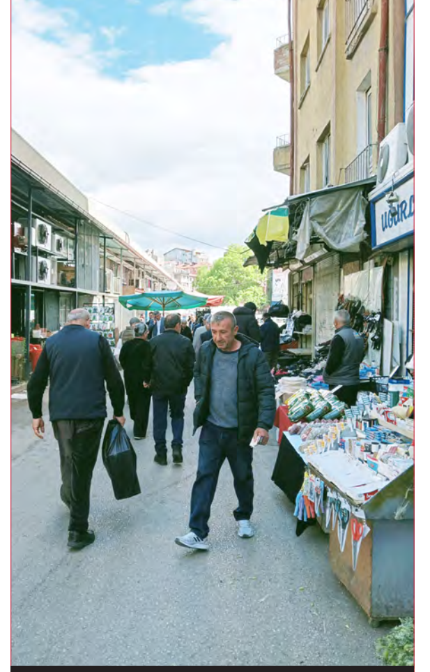
Hal sokağı / Altındağ - 2015