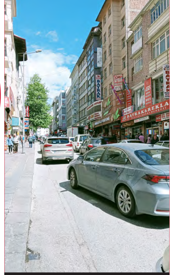
Posta Caddesi / Altındağ - 2015