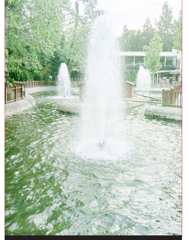
Kuğulu Park / Cankaya - 2016