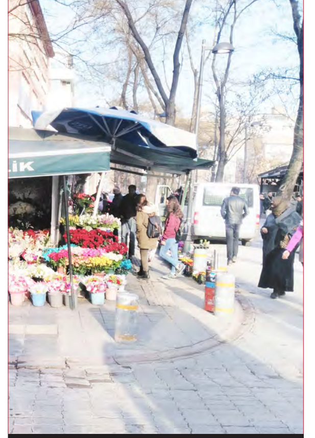
Yüksel Caddesi / Çankaya - 2016