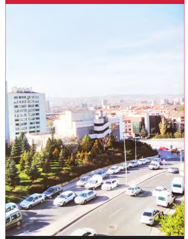
Balgat / Çankaya - 2015