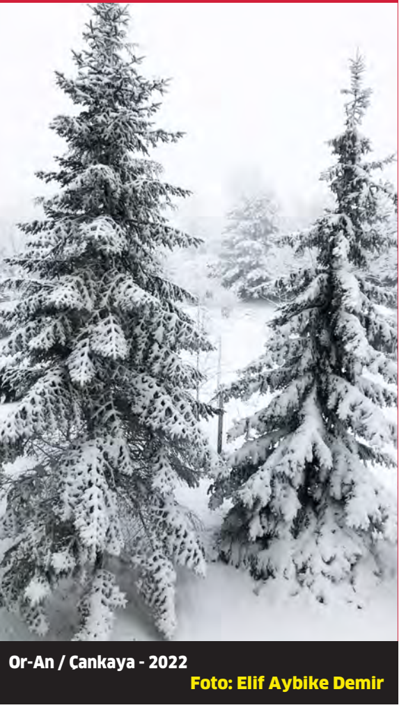
Or-An / Cankaya - 2022

Sincan Kaymakamı ve Sincan İlçe Milli Eğitim Müdürlüğü iş birliğinde İçişleri Bakanlığı Sivil Toplumla İlişkiler Genel Müdürlüğü'nün desteğiyle gerçekleştirilen "Dezavantajlı Bölgedeki Çocukların Müzikte Yetenek Taraması İle Topluma Kazandırılması" adlı proje, Baykuş Fikir ve Sanat Derneği tarafından düzenlenen bir toplantıyla tanıtıldı.