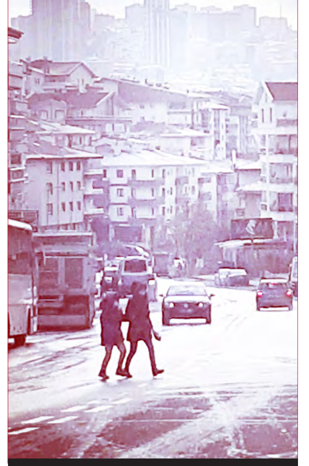
Dereboyu Caddesi / Mamak - 2014

10 yıl önce kurduğu Lir Orkestrası'nda aynı ekip ile çalışmalarına devam eden emekli Bando Astsubayı Ramis Çalimli, müziğin, hayatının bir parçası hâline geldiğini vurguluyor.