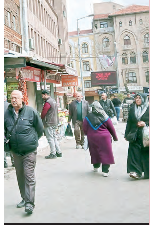
Ulus Hali civarı / Altındağ - 2016

Nogay Türkleri Kültür ve Yardımlaşma Derneği ile TRT AVAZ iş birliğinde düzenlenen "Altınorda'dan Anadolu'ya Nogay Türkleri Belgeseli ve Arslanbek Sultanbekov Konseri", Gazi Üniversitesi Rektörlüğü Mimar Kemaleddin Salonu'nda geniş bir katılımla gerçekleştirildi.