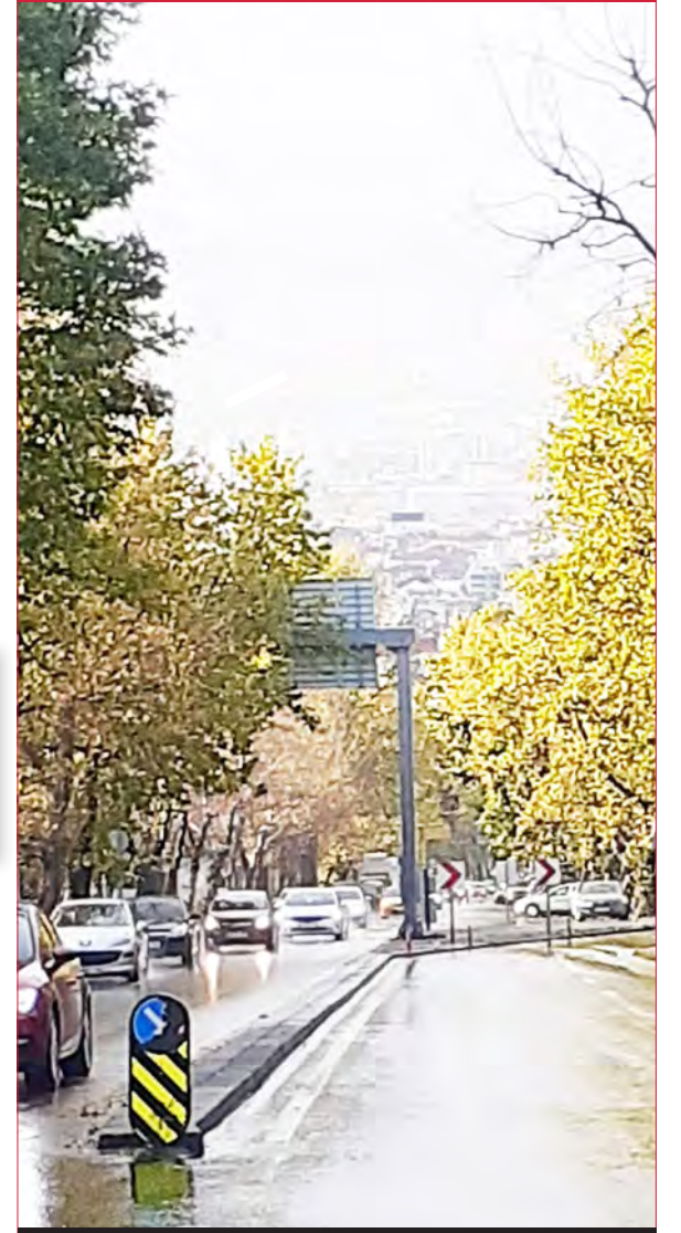
Atatürk Bulvarı / Çankaya - 2018